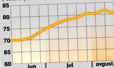
Kretanje veleprodajne cene TNG-a (din/l) (Podaci sa jedne beogradske benzinske pumpe)

– Razlike u cenama gasa u različitim gradovima i regionima uglavnom su posledica tržišnih zakona, odnosno uticaja ponude, potražnje i konkurencije – kaže Tomislav Mićović iz Udruženja naftnih kompanija. Ako u nekom mestu postoji više prodavaca TNG-a, oni se bore za kupce nižim cenama, a ako samo jedna pumpa prodaje gas u krugu od 50 kilometara, jasno je da će biti skuplje. Negde su više cene posledica nešto veće udaljenosti centara za snabdevanje od pumpe, zbog troškova transporta. Na autoputu su cene svih goriva, pa i TNG-a veće nego u gradovima, što je posledica kako tržišnih zakona, tako i činjenice da su troškovi poslovanja na autoputu nešto veći.